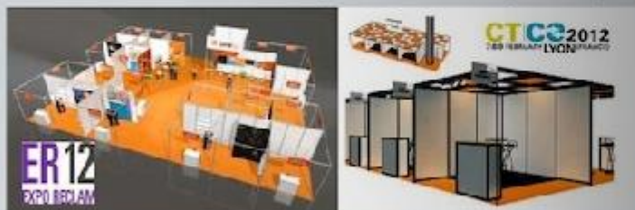
Aimfap pavilion in european trade fairs (Expo Reclam Madrid and CTCO Lyon) Pavillon Aimfap dans des salons européens (Expo Reclam Madrid et CTCO Lyon)