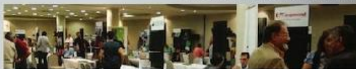
Free travelling road shows in Spain and Portugal | Road shows itinérants gratuits en Espagne et Portugal